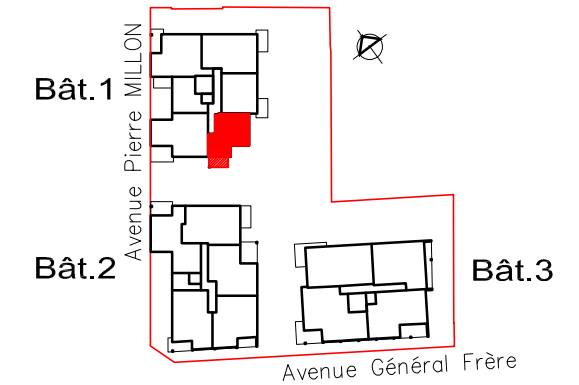
PLAN DE COMMERCIALISATION